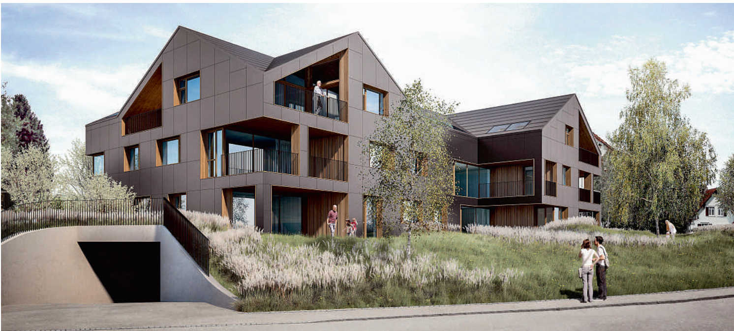
Das energieautarke Mehrfamilienhaus in Brütten setzt Maßstäbe bei der Kombination von Speichertechnologien für Wärme und Strom.

Mit gezielten Simulationen konnte man verschiedene Varianten untersuchen: TABS mit gleicher Vorlauftemperatur für jedes Geschoss, mit unterschiedlicher Vorlauftemperatur je Geschoss, mit geänderter Einbautiefe und Trittschalldämmung sowie als vierte Variante die konventionelle Fussbodenheizung. Die Untersuchungen haben dann gezeigt, dass insbesondere dieses letzte