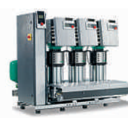
Druckerhöhungsanlage Wilo-Helix EXCEL